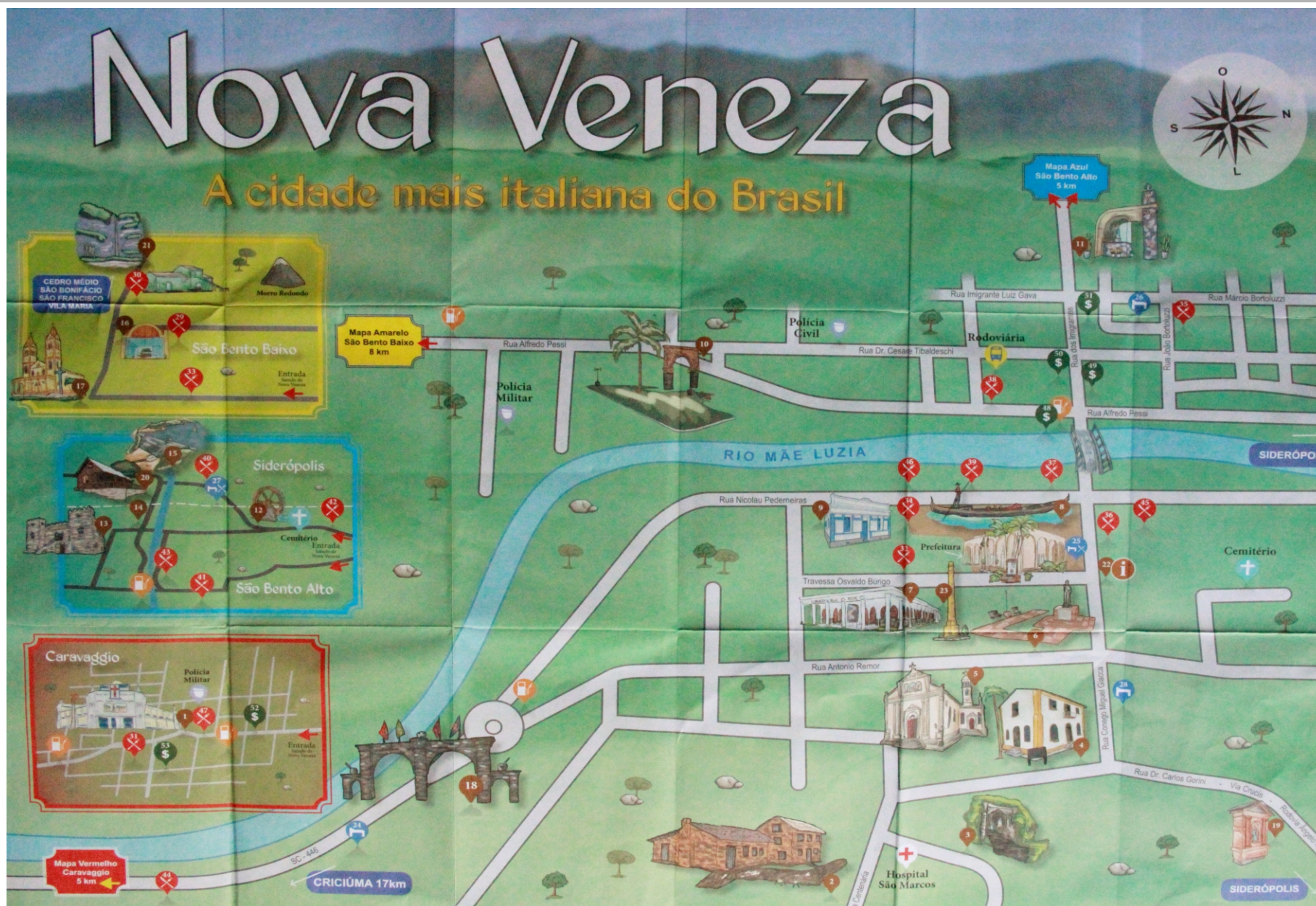
Figura 30: Mapa ilustrativo dos pontos turísticos.