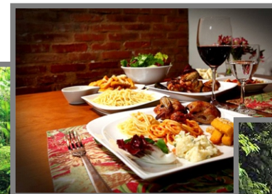
Figura 23: Representação de turismo cultural, ressaltando a cultura local.