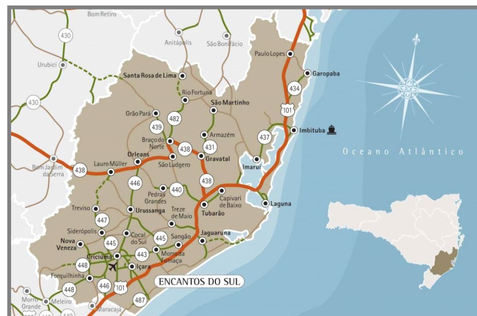
Figura 28: Mapa ilustrativo Rota do Encantos do Sul.

A região sul é delimitada pelo guia turístico Encantos do Sul, abrangendo assim o município de Nova Veneza, ressaltando os pontos turísticos e principalmente ressaltando como a cidade cultiva a herança dos antepassados.