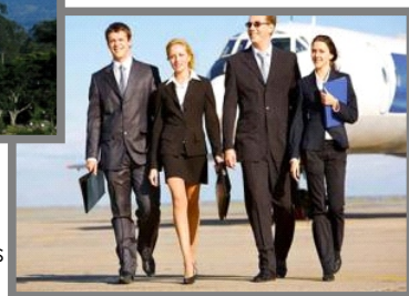
Figura 27: Turismo de negócios