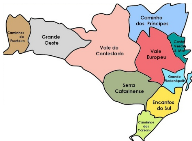
Figura 22: Mapa ilustrativo das regiões turísticas de Santa Catarina

No Estado de Santa Catarina, região sul do país, o turismo é dividido por regiões, conforme figura 08, cada uma com seu potencial turístico e peculiaridades que abrangem do litoral ao interior, apresentando uma diversidade cultural, paisagens diferenciadas e uma arquitetura única, o Estado atrai turistas de várias regiões do país e do mundo, que buscam os diferenciais que somente Santa Catarina poderá oferecer. O município de Nova Veneza está localizado na região turística denominada como Encantos do sul, e se torna destaque pela “italianidade” que é cultivada na região.