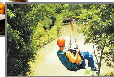
Figura 25 : Representação de turismo de aventura. Fonte: domínio público.