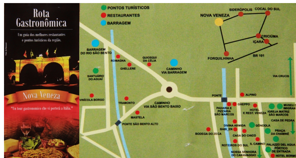
Figura 29: Mapa ilustrativo da Rota Gastronômica.

O município de Nova Veneza busca encantar e atrair os visitantes, por meio das peculiaridades que os moradores cultivam a herança dos seus antepassados italianos, são elas : o patrimônio arquitetônico, a religiosidade, as festas animadas e o gosto pela mesa farta. Por tal motivo a cidade conta com a rota gastronômica, ou seja, um guia dos restaurantes que aliados aos pontos turísticos da cidade, formam a rota gastronômica conforme ilustração na figura XX.